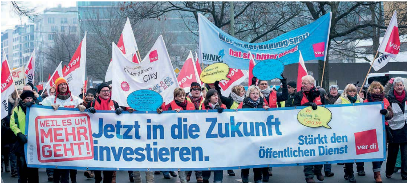
Kolleginnen und Kollegen demonstrieren vor Beginn der Verhandlungen in Berlin für ihre Forderungen.

Unsere Forderung nach Anschluss an die Einkommensentwicklung in der Privatwirtschaft ist mehr als berechtigt.